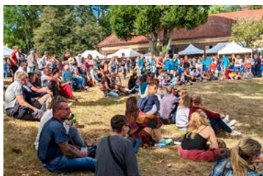
© Fête du bois 2024 au parc du Mineroy / ACA.