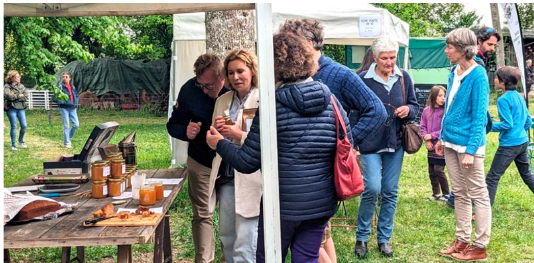
Stand dans le parc du Tournefou, 2025.