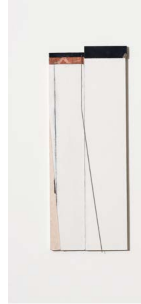
© Daphné Gamble, 2023, Assemblage (couleur) , carton peint bois, fil de fer, 40 x 27 cm, collection Galerie Convergences