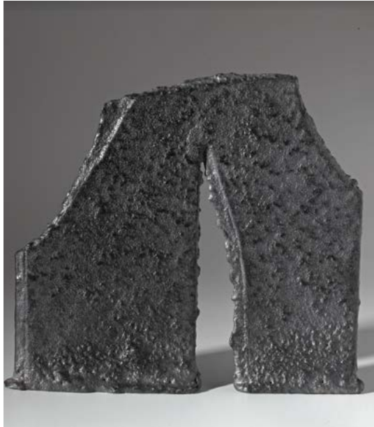
© Robert Groborne, 2015, sculpture N°05415 , 23 x 26 x 2,5 cm

Visites commentées et ateliers images sur réservation.