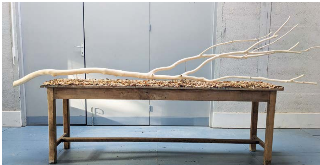
© Dissection of the forest, Picar, artiste en résidence Arbre 2025.

Publié dès janvier, notre programme s'enrichit en cours d'année, n'hésitez pas à consulter son actualisation régulièrement sur notre site : association-tournefou.com