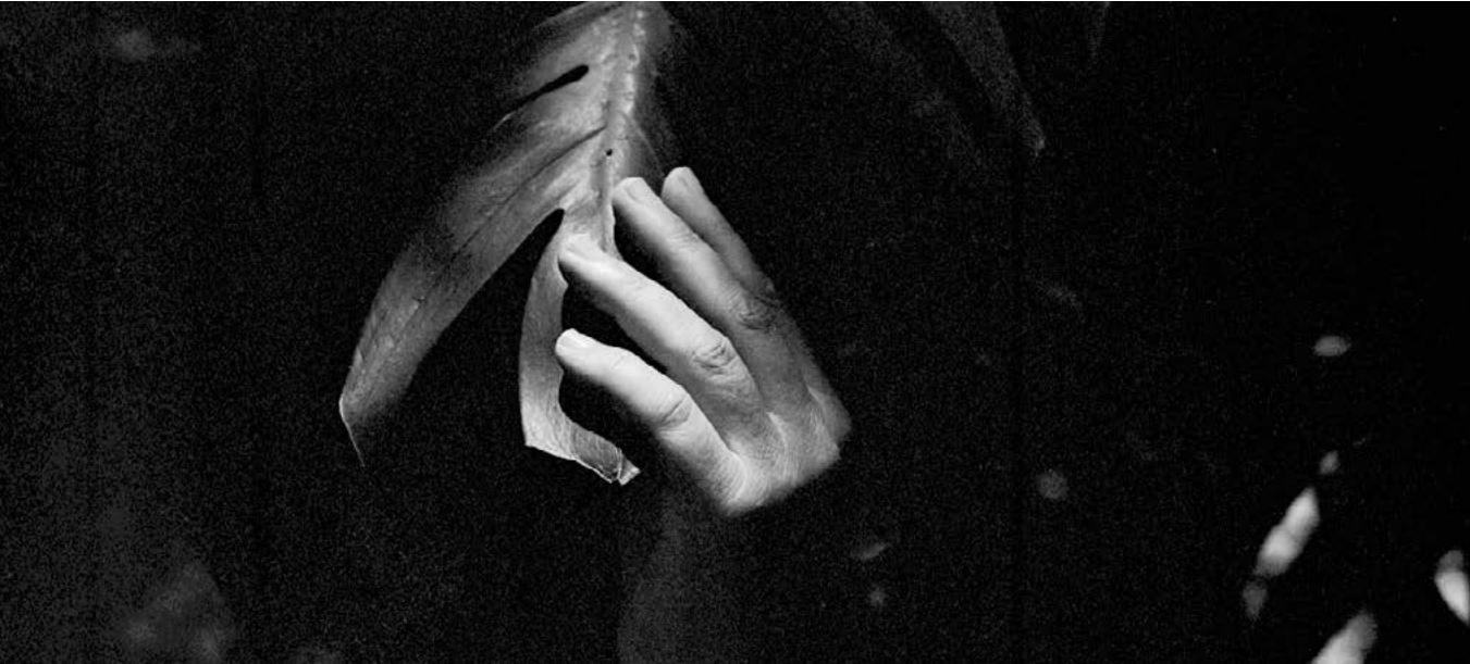
© Isabelle Ha Eav Ruiz, Palme , tirage à la gomme bichromatée, 2023, 80 x 120 cm.

Elle a récemment travaillé sur une interprétation des migrations du vent ; sur la mangrove et les pêcheurs nomades du fleuve Irrawaddy en Birmanie, et récemment sur les rivières ensevelies en Europe. Pour cette exposition, l'artiste propose une sélection transversale de son corpus photographique. Allant des rivières d'Europe aux jungles d'Asie du sud, l'artiste observe la résistance de la nature, et son passage du corps à la lumière.