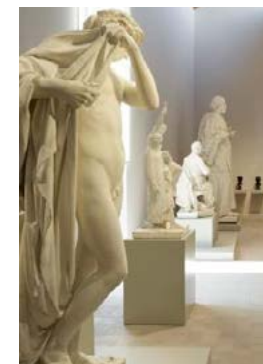
Salle 3, Musée Camille Claudel, Nogent-sur-Seine