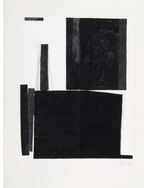
© Anna Mark, 1996, G 321 , gouache et crayon sur fond sérigraphié, 64 x 49 cm