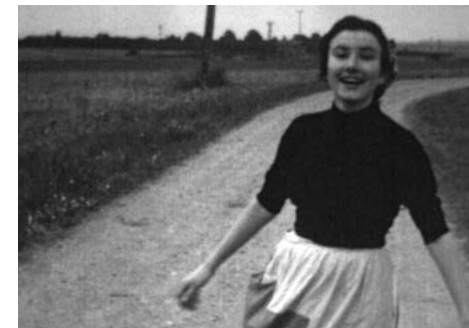
© La photo retrouvée, film documentaire de Pierre Primetens, 2024.