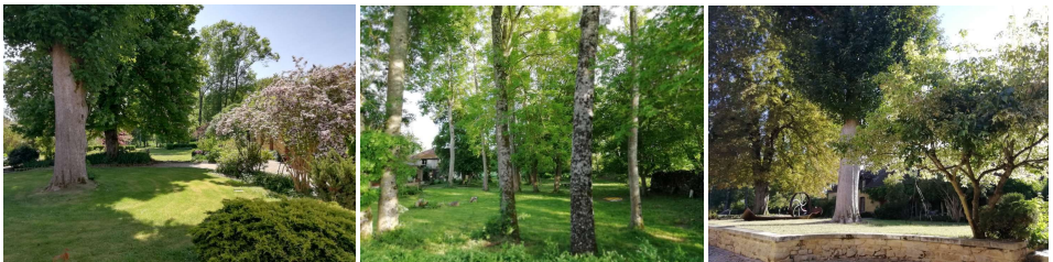
Photographies prises dans le parc du Tournefou en fin d'été

Le Tournefou, lieu de résidence pour l'artiste, est doté d'un jardin avec son érable sycomore presque bicentenaire, accompagné d'un vieux marronnier ; plus bas vers les ateliers, l'espace boisé est composé principalement de frênes et d'érables champêtres. L'artiste fera une présentation au public de sa création dans le cadre de la fin de résidence le 21 octobre 2023.