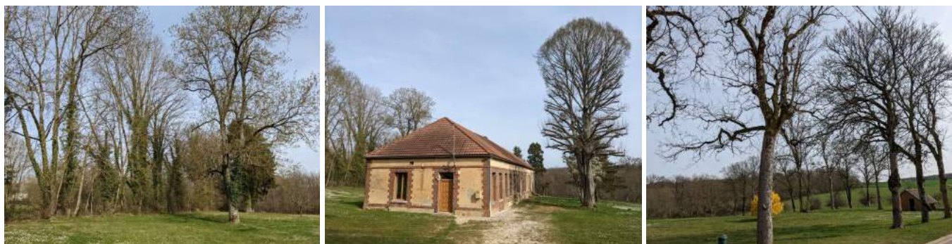
Photographies du parc du Mineroy prises en début de printemps

*Grand rendez-vous du bois et de la forêt dans un site champêtre en plein cœur du Pays d'Othe où des artisans passionnés, des artistes amoureux du bois vous invitent à découvrir leur savoir-faire ; à leurs côtés de multiples acteurs de la filière bois vous expliquent leur rôle dans la préservation, le développement et l'exploitation de la forêt. Des animations rythmeront cette journée dans une belle ambiance où les enfants ont toute leur place. Organisée par l'association Animation Culture Aix-en-Othe.