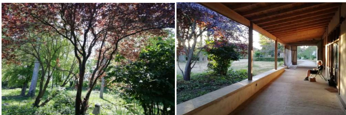
Vues du parc et de de la ruelle des ateliers d'artistes au Tournefou

Des temps de rencontres et d'échanges avec le public seront organisés au cours d'une ou de deux journées maximum pendant la période de création, soit le 11 septembre pour la fête du bois, et, le 25 septembre pour sa fin de résidence au Tournefou.