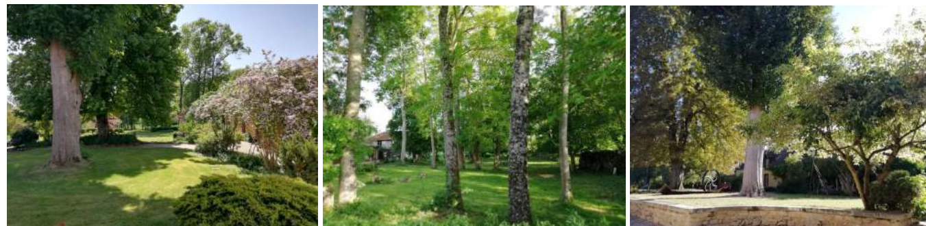
Photographies prises dans le parc du Tournefou en fin d'été

Le Tournefou (commune de Pâlis, Aube) propose en milieu rural un ensemble d'activités artistiques et culturelles qui s'adressent à toute personne dès l'enfance. Il sera votre lieu de résidence et d'atelier, le lieu de création de votre deuxième œuvre in situ, qui sera présentée au public dans le cadre de la fin de résidence le 25 septembre 2022.